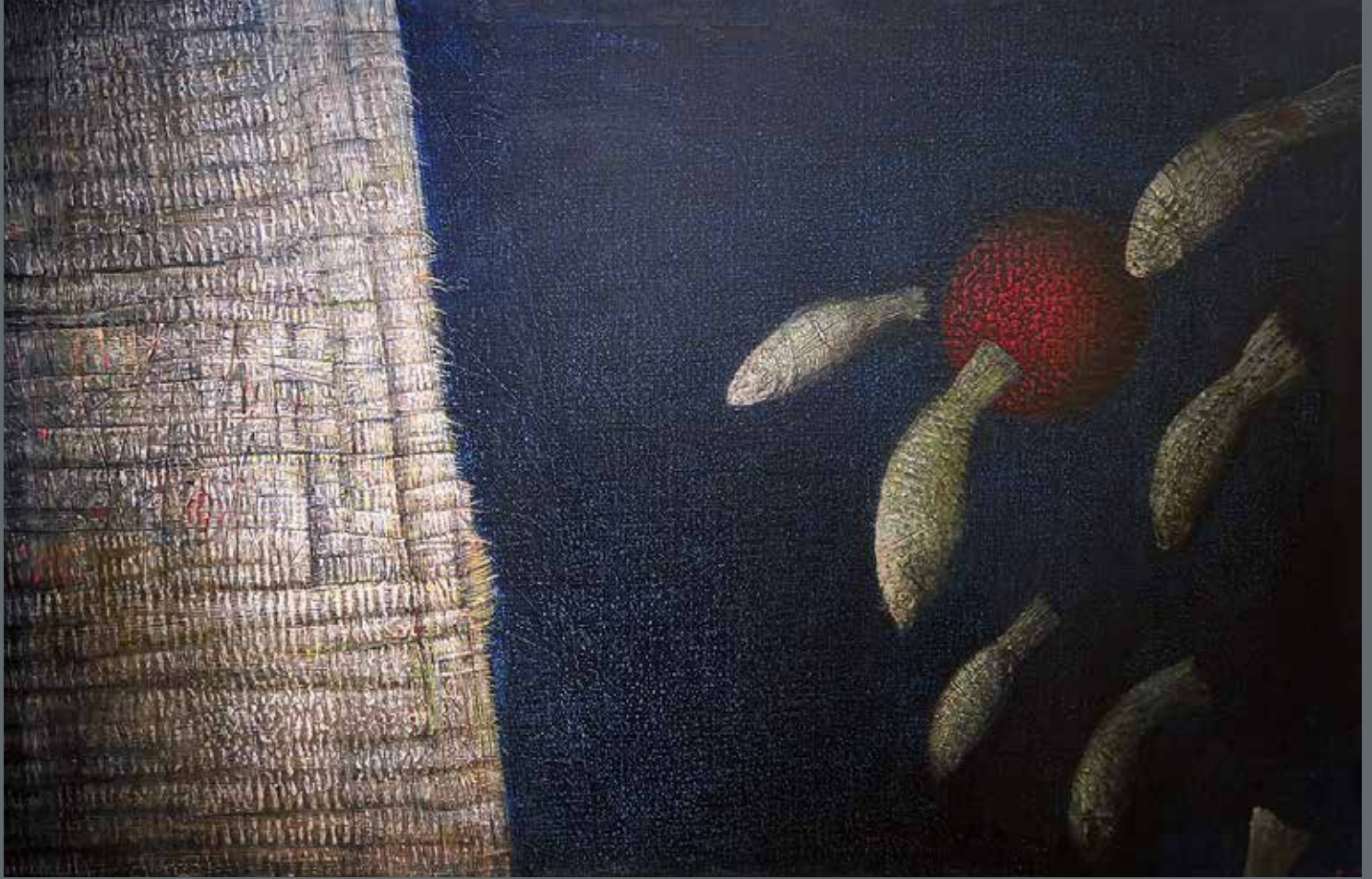
Nouvelle Babylone 130 × 200