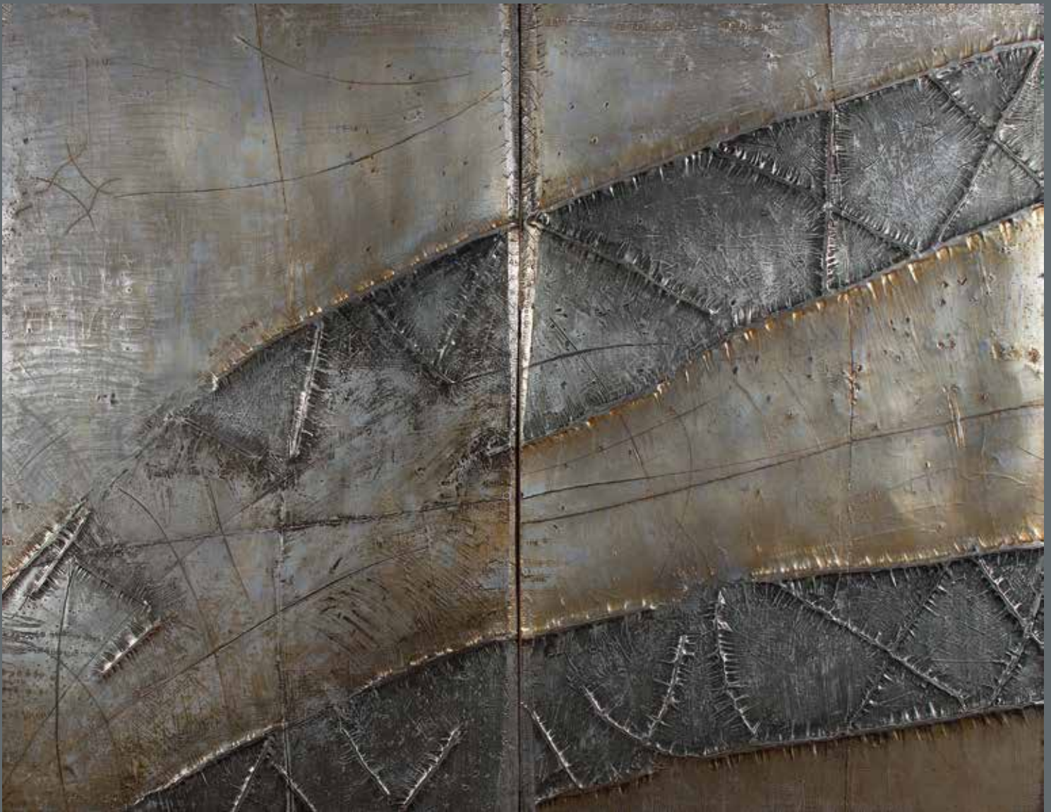
Les Chemins 110x140 Œuvre sur métal, encre de gravure